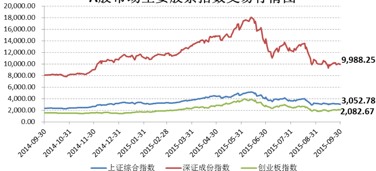
A股市场主要股票指数交易行情图

9月份上证综指跌幅4.78%，收盘3,052.78点；深成指跌幅5.32%，收盘9,988.25点；创业板涨幅4.30%，收盘2,082.67点。本月股市在市场熔断机制、持股超1年股息红利免征个税等利好政策推动下，上证综指和深证成指跌幅大幅缩窄，创业板指更是出现正的增长。