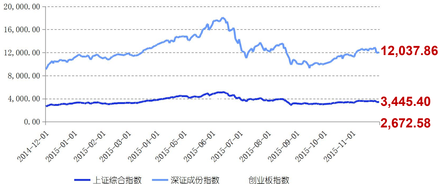
A股市场主要股票指数交易行情图

11月份上证综指上涨1.86%，收盘3,445.40点；深成指上涨4.26%，收盘12,037.86点；创业板涨幅7.84%，收盘2,672.58点。在美国加息预期可能性增大、证监会决定恢复IPO等影响下，股市涨幅较10月大幅下降。