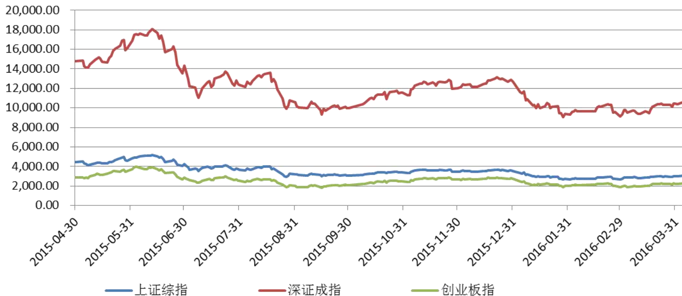
A股市场主要股票指数交易行情图

3月份上证综指开盘2688.38点，收于 3009.92 点，11.75%的上涨创造了从2015年6月份以来的上证最高月涨幅；深成指开盘9116.56点，收盘 10455.37 点，上涨14.93%；创业板指开盘1881.32点，收于 2238.29 点，上涨19.05%，超过去年10月的19%。上证综指、深证成指、创业板指较之二月回暖明显，强势上涨均在10%以上，且沪综、深成、创业板三大股指的跌幅均在15%以上，3月行情完美收官，为2016第一季度画上满意的句号。